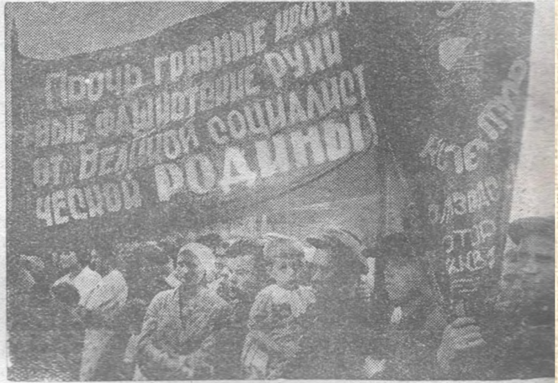
На митинге трудящихся города и района 23 июня.

Речи выступивших на митинге гг. Хорошилова К., Литюк