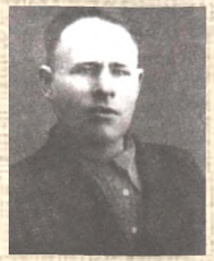
КОННЫХ П. А.